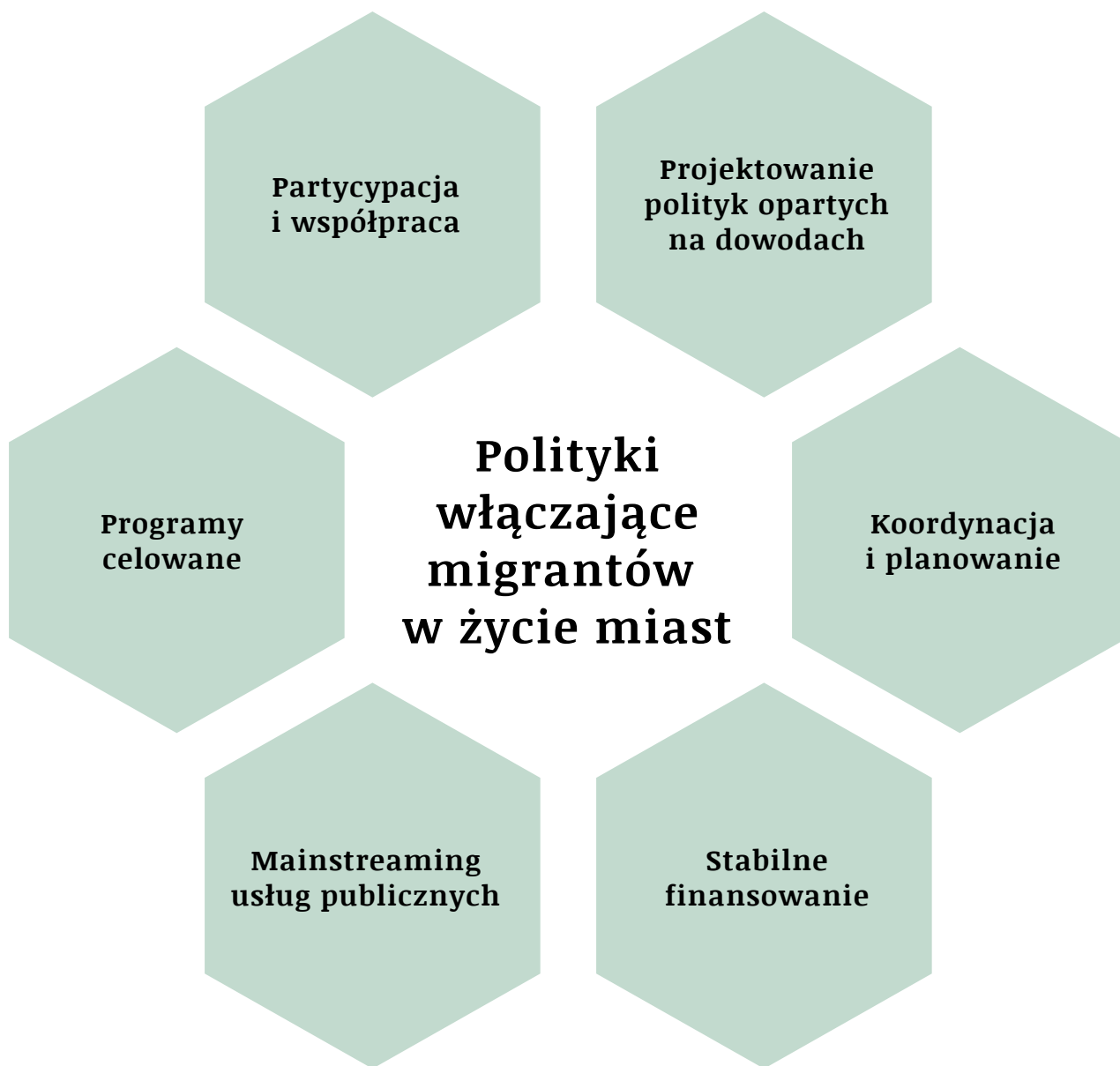
Rysunek 1. Model lokalnych polityk włączających migrantów